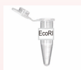
制限酵素の精製 (70年代)